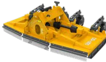
Modèle repliable (G5R)