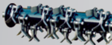
Rotor herbe (standard)